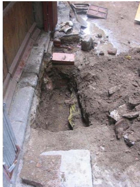
FOTO 2. Vista de la cala 2.