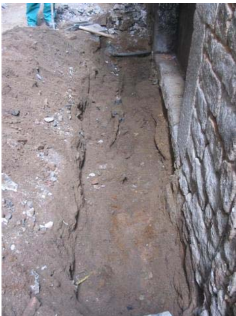
FOTO 1. Vista de la cala 1.

Feta manualment davant de la porta del número 8 del carrer Cirera. Les mides són d'un metre per 0'50 m i 0'40 de fondària. La cota final es situa a 3'84 m.s.n.m. En aquest cas també es va repetir la mateixa seqüència que en els anteriors, retirant-se una part del sauló fins arribar als serveis.